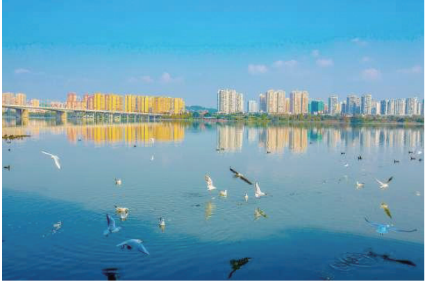
随着遂宁观音湖生态湿地公园的建设,越来越多的红嘴鸥被吸引到观音湖栖息。