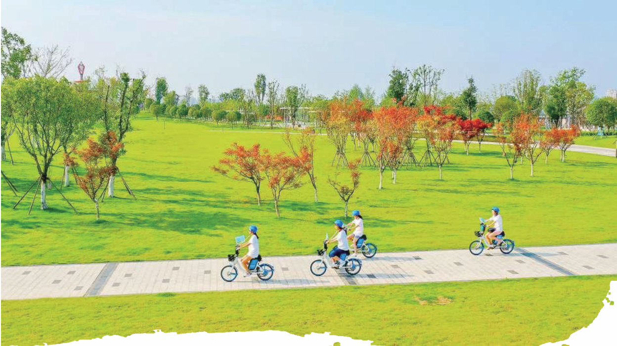
遂宁市河东新区二期湿地公园城市大观段,市民正在骑车游玩。