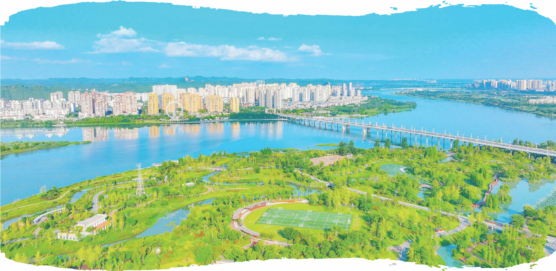
俯瞰遂宁九莲洲生态湿地公园。