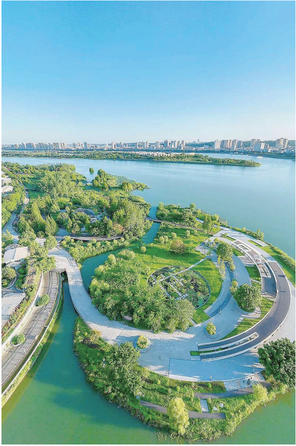
环境优美的遂宁市河东新区湿地公园。

初秋的晚霞浸入云彩,在九莲洲湿地公园里,市民向虹一家正享受着“公园生活”。行走涪江河畔,绿草如茵,碧水潺潺,舒心美景惹人流连……这幅“天蓝地绿水清”的生态画卷构建起“生态公园名城”发展新格局,映衬着遂宁绿色发展的“底色”。 筑“生态公园名城”,遂宁有天然优势。一直以来,遂宁把践行绿色发展理念,推动城市在青山绿水中自然生长作为全市上下的广泛共识和一致行动,“城市中有公园”正逐渐嬗变为“公园中有城市”。 655公里的“遂州绿道”将65个公园、12100亩绿地有机串联起来,推窗满眼是绿色、满心是幸福。如今,眺望涪江两岸、漫步东西两城,从湖泊水系到公园绿地、从城市干道到街头巷尾、从公共区域到商住小区,人们可以全时空、全领域感受到遂宁“山水林田湖岛”环境之美,“一半山水一半城”的格局之美,“疏密有度、错落有致”的风貌之美。 为进一步绘就“生态公园名城”美好愿景,遂宁正从夯实全域优良生态本底、构建城乡空间大美格局、完善均质覆盖公园体系、打造通达城乡绿道网络、培育生态价值营城场景等5个方面强力推进“生态公园名城”建设。人不负青山,青山定不负人。结合国土空间“三区三线”调整试划,截至目前,全市已有51个项目开工,38个项目部分开工,已筹集到位资金25亿元。安居区凤舞琼花公园、遂宁高新区“口袋公园”、游园新建工程等5个项目已完成所有建设内容,正在准备竣工验收。 遂宁日报全媒体记者 梁惠 据《遂宁日报》