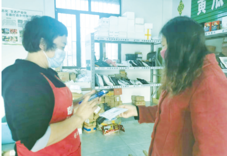
村民在黄瓜山农村综合服务社取快递。