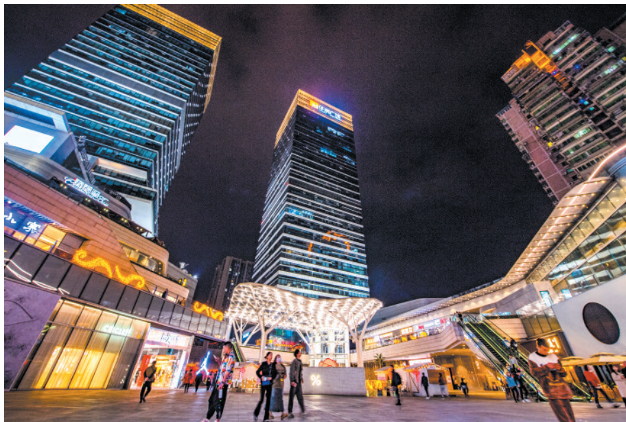
位于自贸试验区九龙坡板块的万象城一派繁华景象。

这也是九龙坡板块围绕功能定位和企业需求积极开展系列案例创新的成效之一。为持续深化“放管服”改革,加快构建简约高效的事中事后监管体系,九龙坡板