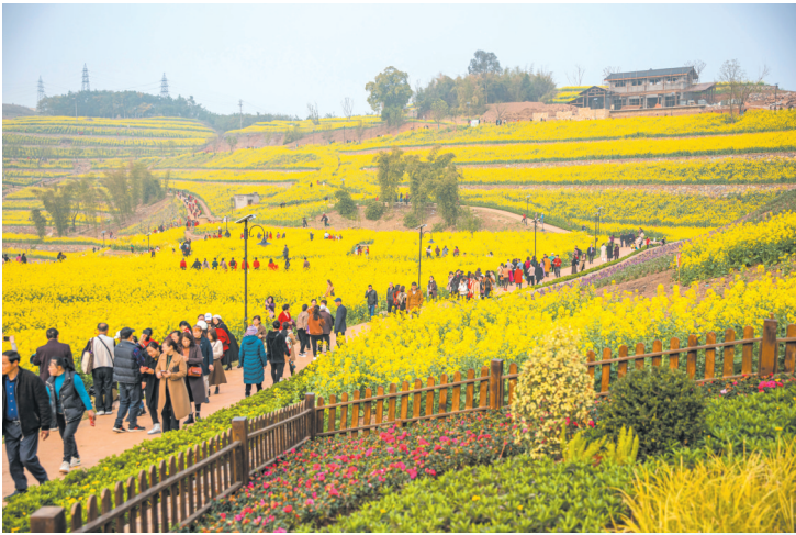
赏花市民络绎不绝