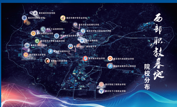
在永大中专院校2022年基本情况

《成渝地区双城经济圈建设规划纲要》明确支持永川建设西部职教基地,基地现有大中专院校17所,在校学生17.6万人,教职工10336人,共开设44个大类264个专业,每年向社会输送4万余名技术技能人才,就业率长期稳定在96%以上,其中在成渝地区就业的占61.36%。