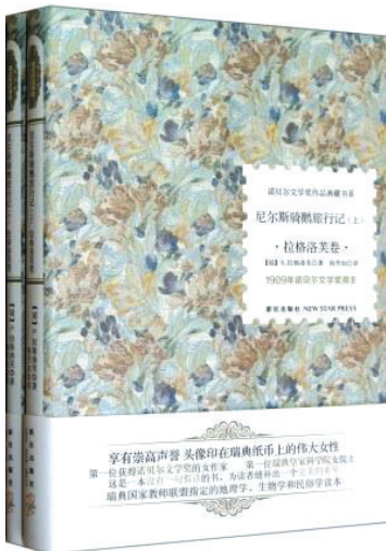
《尼尔斯骑鹅旅行记》