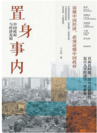
《置身事内:中国政府与经济发展》

这是一本难得的新时代政治经济学入门读本。书中,作者用“白描”手法,线条简单又清晰地勾勒出中国政治经济社会的过去、现在和未来,通过大量的案例、数据和图表,回答了中国经济的“为什么”和“怎么办”。中国经济为什么创造奇迹?这是本书上篇回顾的主线。中国经济下一步会怎么办?是本书下篇剖析的重点,从城市化与不平衡、债务与风险、国内国际失衡、低消费与产能过剩、中美贸易冲突、再平衡与国内大循环等方面进行了抽丝剥茧的归纳,解