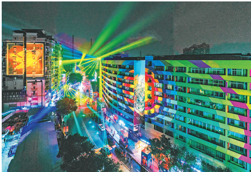
中国·重庆首届国际光影艺术节在黄桷坪举行。

脉寻根三大行动,做靓“阅见九龙”全民阅读、“云享九龙”数字文化、“畅游九龙”文明旅游、“艺赏九龙”文艺惠民、“博物九龙”文博体验五大活动。