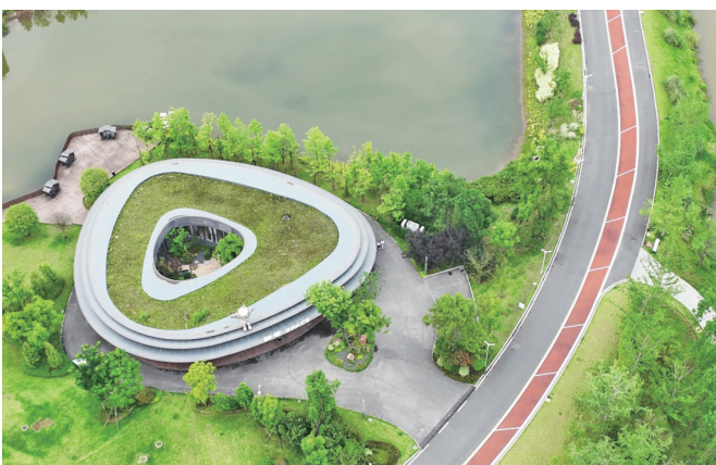
►明月湖公园环湖步道

老而宁静,走在宽阔清幽的石板路上,曾经的戏台、庙宇、祠堂和商铺映入眼帘,让人产生穿越到另一个时空的错觉。