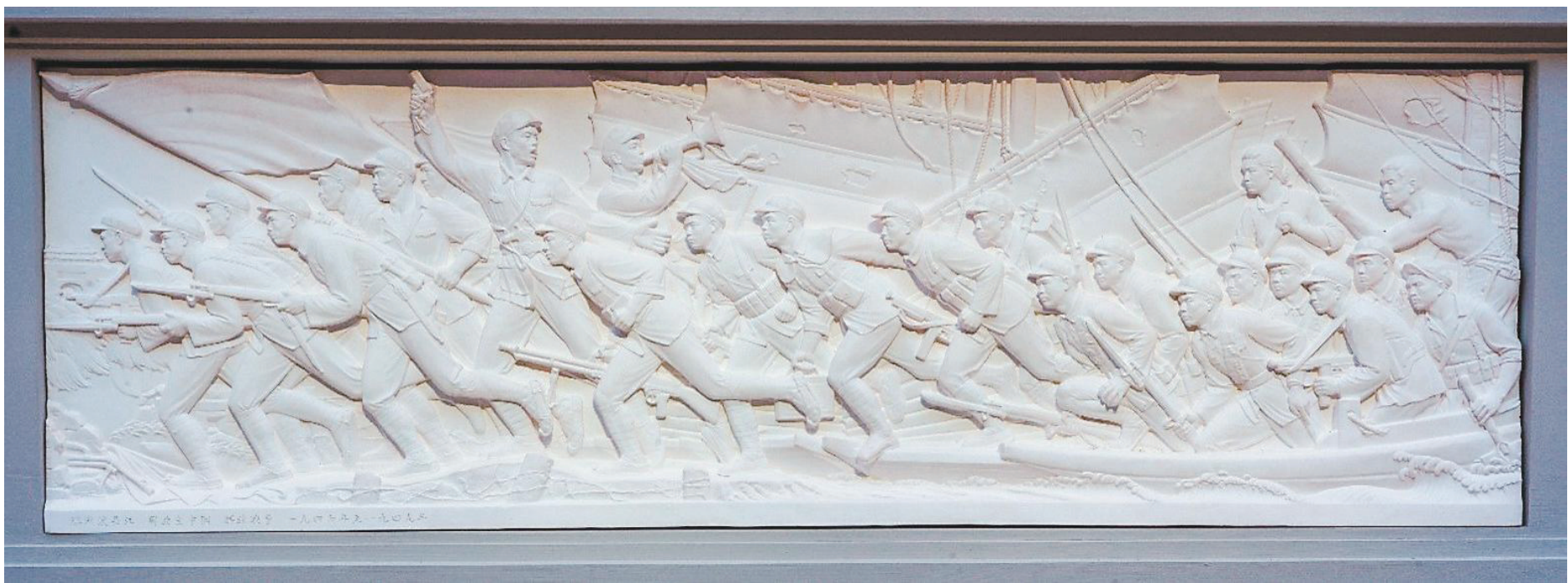
《人民英雄纪念碑浮雕·胜利渡长江》