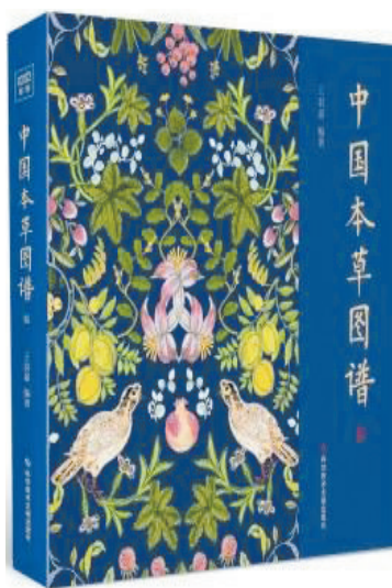
《中国本草图谱》 作者:王羽嘉 出版社:科学技术文献出版社

《食物本草》可以说是明代食药养生的集大成者,是我国现存内容丰富的食药疗法专著。全书共有近400种本草,分为水、谷、菜、果、禽、兽、鱼、味八类,至今仍是中医食疗类著作的经典代表。《中国本草图谱》汇聚168种《食物本草》中中国常见的本草精华,按照二十四节气的顺序编排,让读者了解其别名、功效、食用方法等。读完它,就像经历了一场复古而优雅的本草之旅。