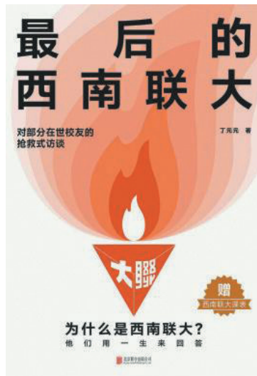
《最后的西南联大》 作者:丁元元 出版社:北京联合出版公司

西南联大可谓是中国教育史上的珠穆朗玛峰。本书作者、著名记者丁元元从2014年开始,就以近乎侦探的方式,通过新闻报道、历史档案、联大校友录等,寻访联大在世校友,进行抢救式采访。他们的口述形成了此书,也让作者触摸到联大精英教育的本质,为当代高等教育保存了一份珍贵的参考。就在他采访、写作过程中,这批最后的联大弟子也在不断逝去。这让本书很可能成为最后一份,以亲历者集体口述形式保存联大教育细节的珍贵资料。