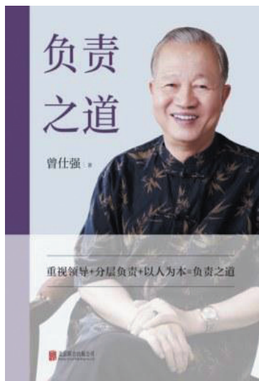
《负责之道》 (西西弗书店推荐) 作者:曾仕强 出版社:北京联合出版公司

负责之道,既是符合中国人特点的管理方式,又是一门立足中国国情的领导艺术。作者从企业的日常管理出发,将领导与管理、分层负责与分层授权等内容进行比较,为企业管理者提供一条符合中国式管理的负责之道。作者在书中强调:一个企业的成败关键在于人,而人的关键则在于其所拥有的价值观念。管理的主轴,或以事为本或以人为本,如果以人为本,就不应该视人为物,而应该视人为人。