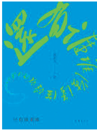
《还有谁谁谁》 (精典书店推荐) 作者:黄永玉 出版社:作家出版社

社会孤独感的成因;《当代汉语新诗类型》《南腔北调:方言里的中国》秉千秋古语,承万载华魂;《负责之道》《称霸未来的企业》展望了商业发展的蓝图与路径……初冬好辰光,天寒日暖有书香。 重庆日报记者 赵欣 实习生 钱奕婷