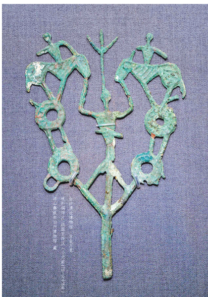
武隆关口一号墓内出土的木牍。