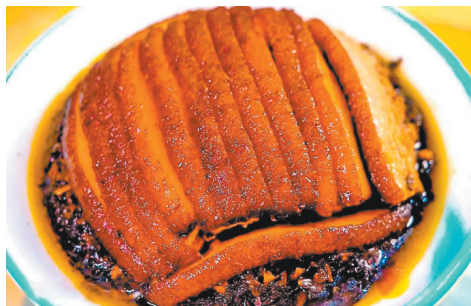
大足宝顶冬菜烧白