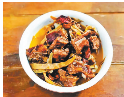
城口干四季豆炖腊排骨