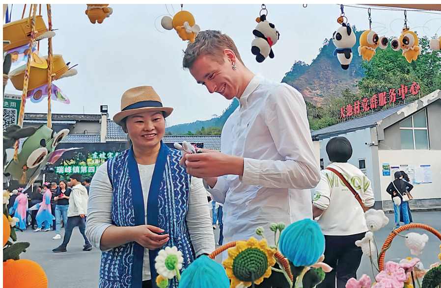
外国游客购买萤火虫文创产品。