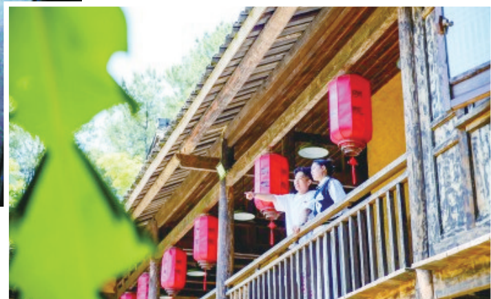
游客在“花房筑·明院”驻足欣赏风景