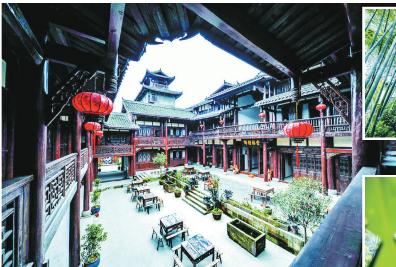
保存完好的丰盛古镇十全堂一隅