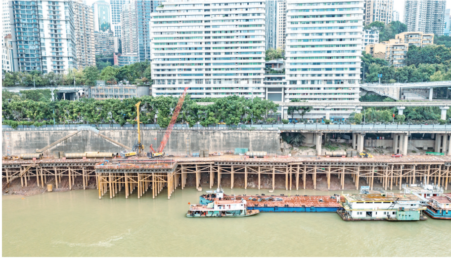
“两江四岸”嘉陵江段进展顺利,预计今年将全线贯通渝中19.1公里两江岸线。