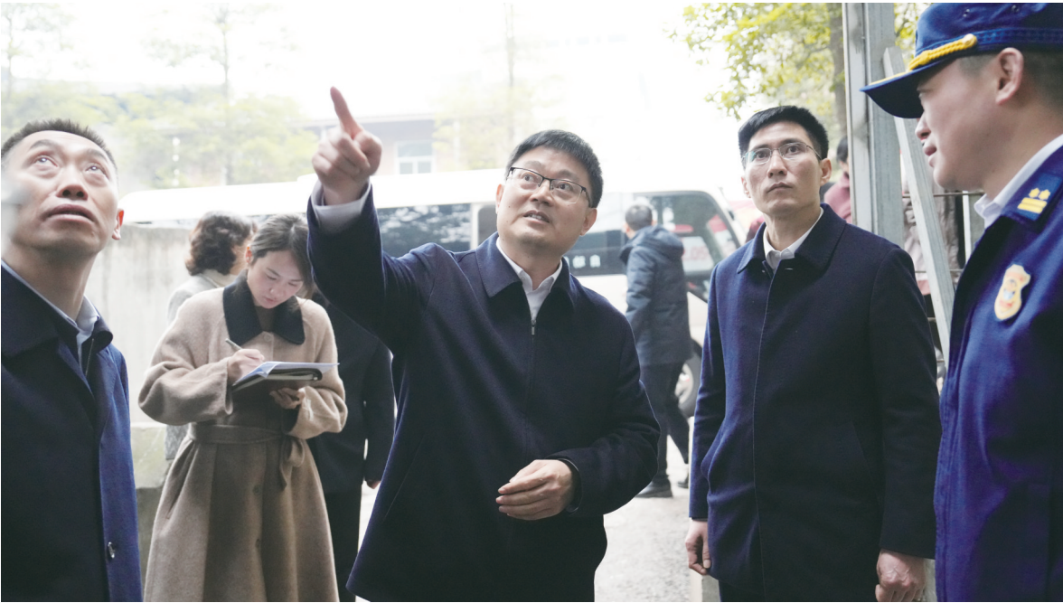
1月6日下午,永川区委书记关衷效前往永川高新区三教产业园和三教镇,调研融合发展情况。 图为关衷效在三教镇农贸市场调研。

走进三教镇基层治理指挥中心,关衷效调研了“大综合一体化”行政执法改革试点建设情况。他指出,要推动执法力量向基层下沉,聚焦实现“综合查一次”,强化执