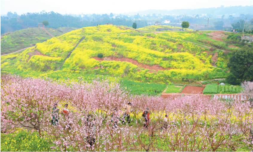
圣水湖桃花次第绽放。