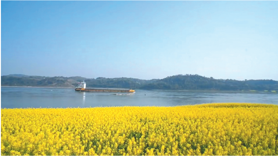
长江畔的油菜花与碧水相映,形成独特的“水岸花廊”景观。