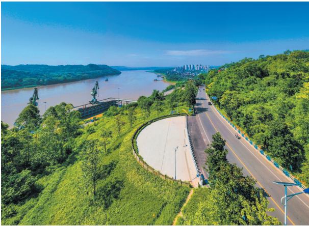
朱沱镇四望山观景台。