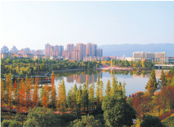
兴龙湖公园五彩缤纷。