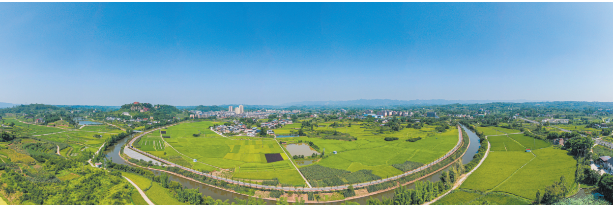
来苏镇观音井村伍家坝。