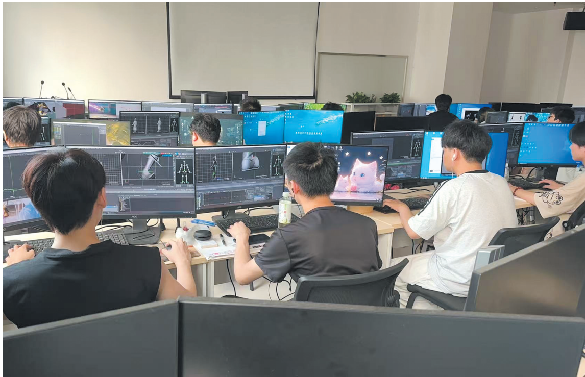
云谷·数字人才产教融合实训基地。