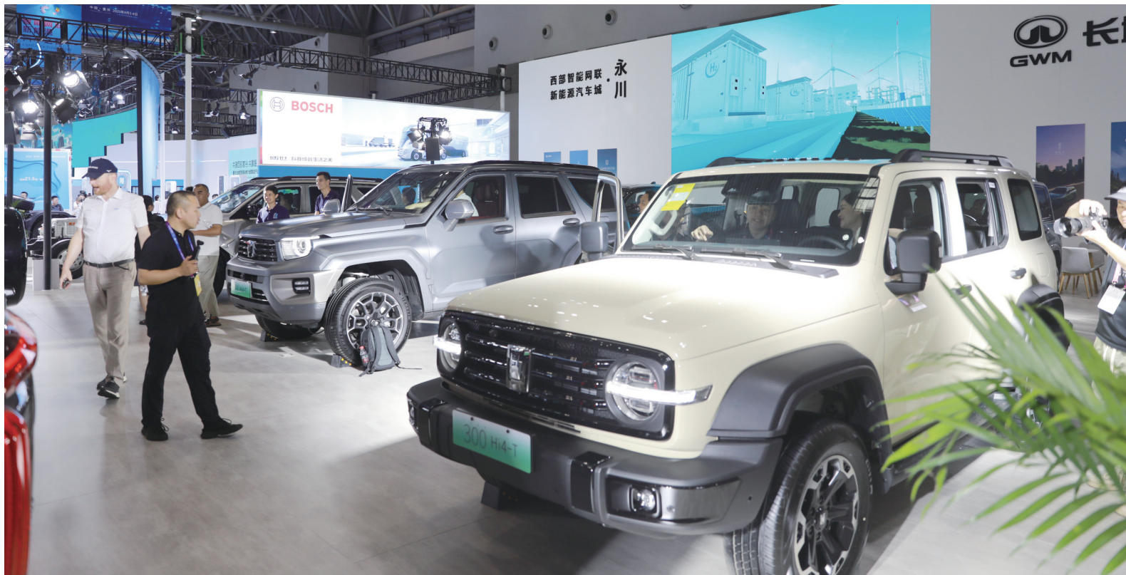
长城智能网联新能源汽车惊艳亮相。