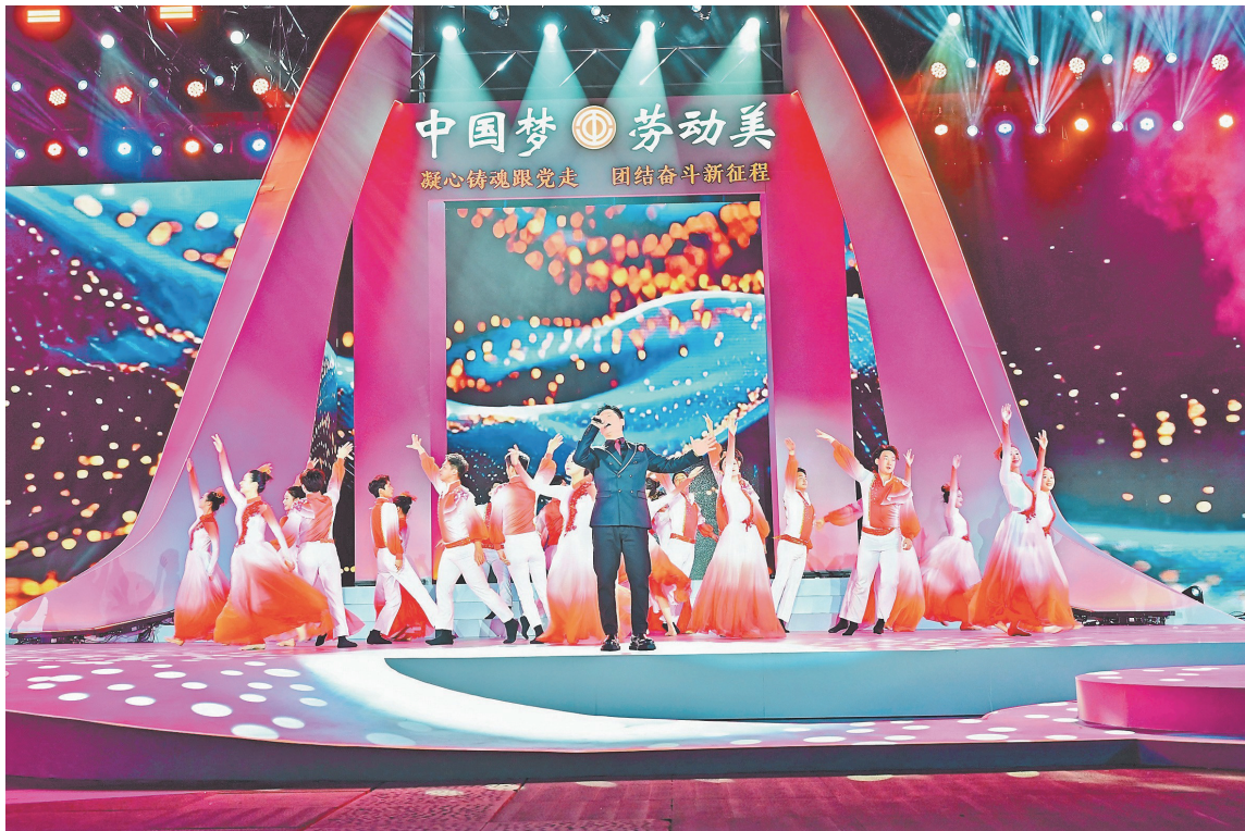
► 图为总决赛现场。

据悉,本次大赛今年4月启动,共征集到300多件原创音乐作品。总决赛上,大渡口区总工会报送的《匠心》和铜梁区总工会报送的《一生为龙》获得一等奖。