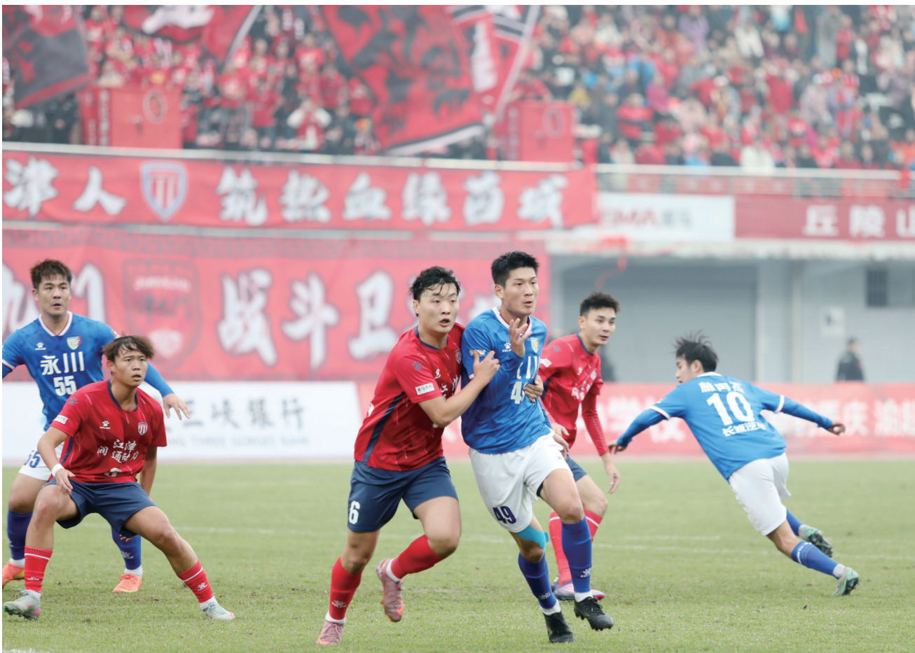
永川长城汽车队(蓝色)与江津润通动力队(红色)在场上激烈交锋。

本报讯(渝西部市报记者 陈欣薇/文)初冬微寒,绿茵场上的热力却丝毫未减。11月22日下午,2025重庆城市足球超级联赛渝西赛区战火再起,江津体育场内,永川长城汽车队与江津润通动力队激烈交锋,最终以0:0握手言和。尽管场上未分胜负,但球迷们山呼海啸般的助威,早已将整个赛场点燃。