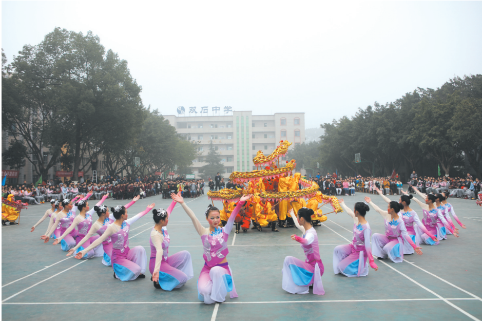
正在演出的双石“小金龙”。

耍龙灯。 耍龙灯即“舞龙”,民间又叫“耍龙”或“舞龙灯”,在农历正月初一拜年到正月十五闹元宵期间,永川许多场镇都要“耍龙灯”,观者众多。永川的龙舞以双石“小金龙”、五间“竞技龙”和吉安石松“板凳